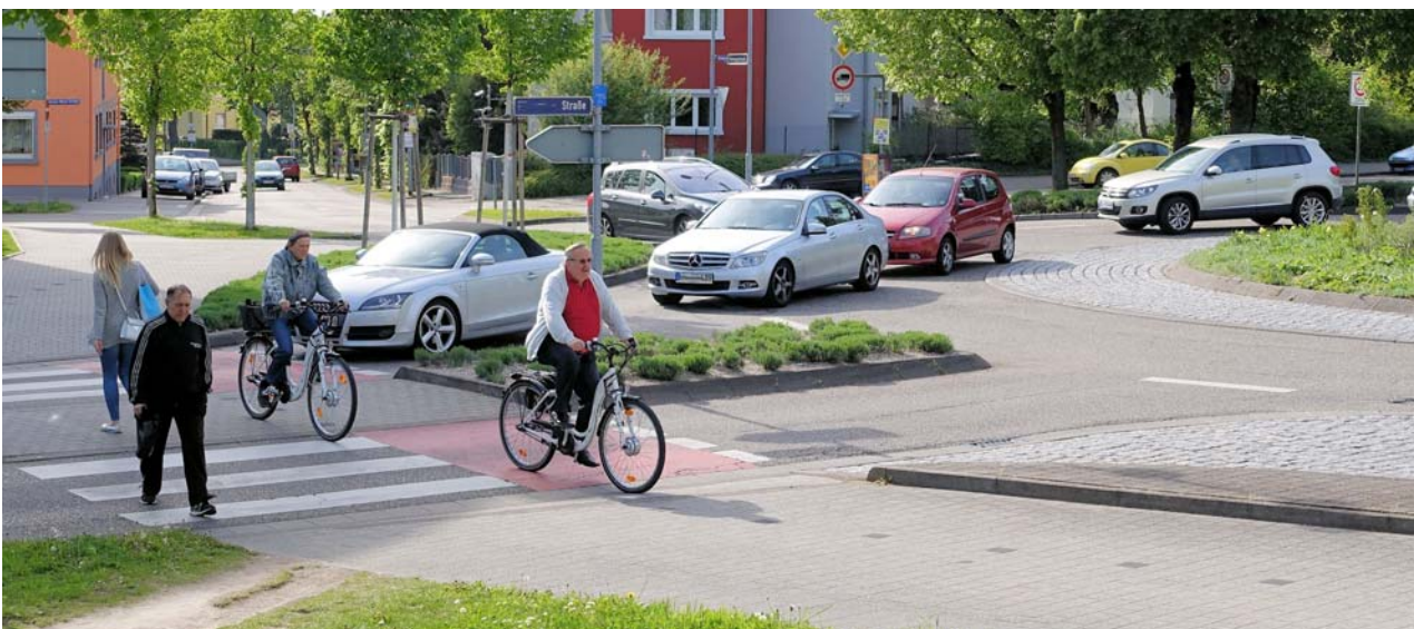
Neu in KREISEL 8.2 : Berechnung der Kapazität von Ausfahrten an einstreifigen Kreisverkehren